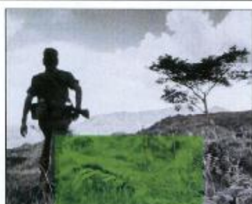
carlos cortés CRUZ DE OLVIDO